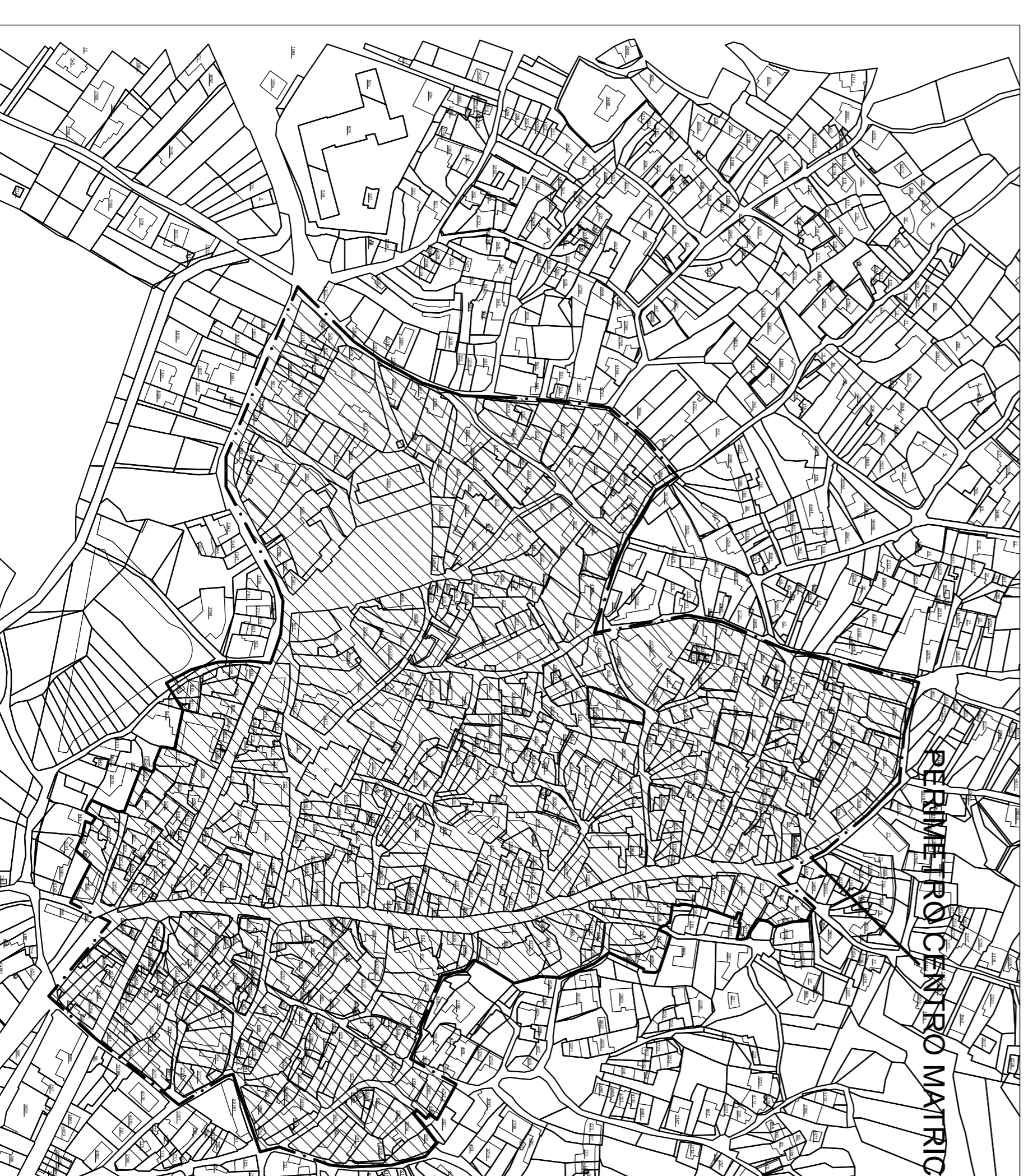
STRALCIO CATASTO FABBRICATI 1:2.500